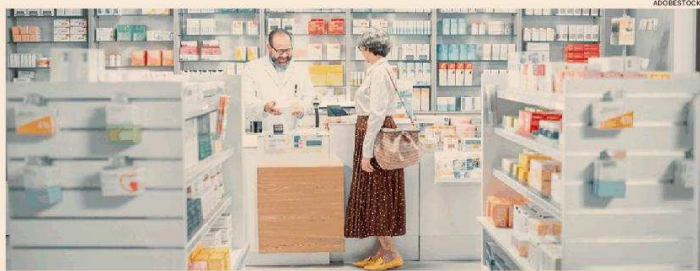
Farmacie. Tornano tra i parametri dell'indagine, presidi sanitari ormai capaci di erogare servizi di base, vaccini e assistenza