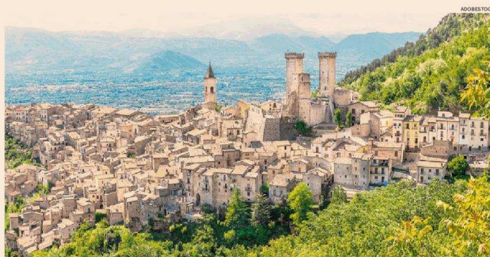
Le criticità. Per i piccoli Comuni nodo competenze e fondi: per far partire gli investimenti del Pnrr