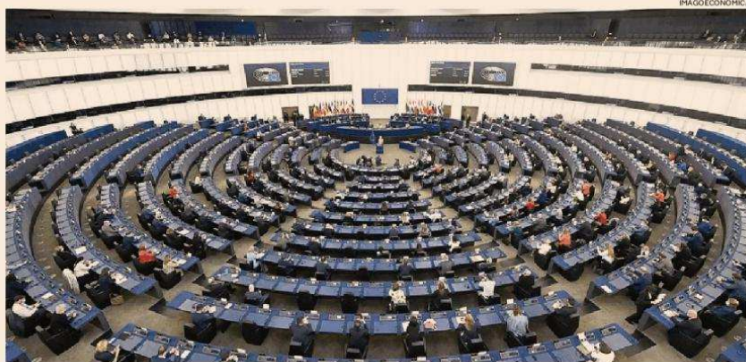
Protagonista. Il Parlamento europeo in uno dei momenti di una sessione plenaria