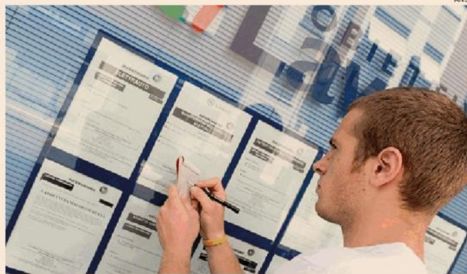
Lavoro. Il governo studia misure per favorire l'incontro tra domanda e offerta

La piattaforma, spiegano dal ministero guidato da Marina Calderone, nasce per rispondere ad un'esigenza contingente: l'attuazione delle nuove norme su Assegno di inclusione e il Supporto per la formazione e il lavoro (che sostituiranno il Reddito di cittadinanza). Il ministero del Lavoro ha però in mente un progetto più ampio con un approccio evolutivo, anche rispetto all'infrastruttura: oggi un'architettura informatica non frazionata che velocizzi la presa in carico dei beneficiari dei nuovi strumenti previsti dal decreto Lavoro; domani un sistema in grado di rispondere al mercato del lavoro contemporaneo nel suo complesso, con la possibilità di personalizzare la disponibilità anche a livello geografico. I dati delle persone registrate sulla piattaforma, dopo l'autorizzazione, saranno visibili su