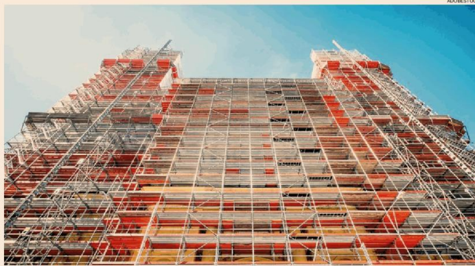
Il balzo del bonus.

L'altro dato invece non fa dormire sonni tranquilli al ministro dell'Economia, Giancarlo Giorgetti, che aveva "denunciato", nella drammatica audizione parlamentare sulla Nade del 10 novembre, uno scostamento di 37,8 miliardi nei conti pubblici dovuto al Superbonus, ma aveva aggiunto di fronte ai parlamentari che il dato «potreb-