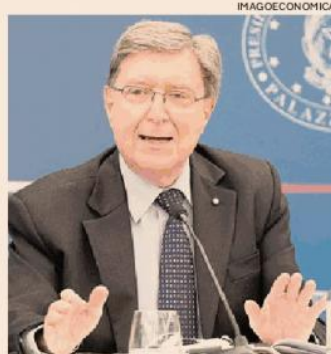
Ministro. Enrico Giovannini

Si apre così la partita dei nuovi fondi europei, che sarà una partita fra governo e regioni: Giovannini intende giocarla per lasciare una pianificazione nazionale il più possibile unitaria, definitiva e stabile dei 298,5 miliardi di investimenti indicati dal Def come fabbisogno complessivo al 2036 (279,4 per la mobilità, 12,4 per l'acqua e 6,7 per l'edilizia sostenibile). Molto si è già fatto. «Sono stati già ripartiti - ha spiegato Giovannini - 218,9 miliardi di risorse, mentre il fabbisogno residuo è di 75,9 miliardi, di cui 70 per gli investimenti nella mobilità». Il ministro cita ad esempio il buon lavoro fatto con le Regioni per la prima ripartizione da 5 miliardi del Fsc: risorse concordate per completare il quadro dei finanziamenti in un quadro