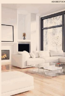
Dimore. L'interno di un'unità di pregio

Le compravendite oltre il milione di euro si concentrano soprattutto in 5 regioni. Guida la Lombardia con 1.703 immobili (pari al 40,9% dei deal totali); seguono il Lazio (804, pari al 19,3%) e la Toscana (588, il 14,1% del totale). Poi Campania (312 compra-