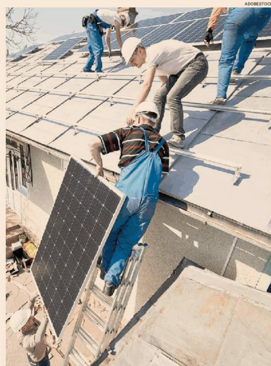
Efficientamento energetico. Nuovo modello per la comunicazione dei lavori

Funzione pubblica. Gli uffici al lavoro con Regioni e comuni con l'obiettivo di chiarire e fugare i dubbi. Anci e Ordine ingegneri: bene la semplificazione