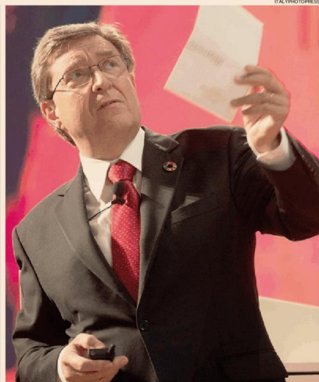
Infrastrutture e mobilità sostenibili. Il ministro Enrico Giovannini

Tutto il piano poggia, quasi fidejuristicamente, sulla capacità di Rfi di risolvere tanti problemi e correre.