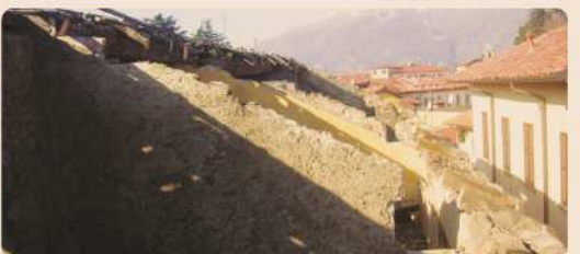
Riqualificazione edilizia di un immobile residenziale