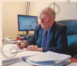
Il Presidente Nazionale Arnaldo Rodaelli al lavoro in Associazione

E' dunque evidente che un tale contesto non può che trarre beneficio da interventi di riqualificazione edilizia atti al conseguimento del benessere dei futuri dal punto di vista della sostenibilità, della sicurezza e anche dell'impatto estetico. Assumono dunque un'importanza essenziale tutte quelle azioni finalizzate a stimolare la committenza e incoraggiare all'offerta real-