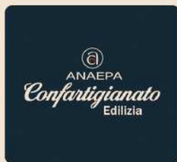
ANAEPA, Associazione Nazionale degli Artigiani dell'Edilizia, dei Decoratori, dei Pittori e Attività Affini