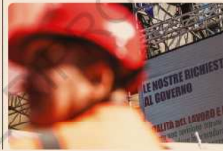
Roma, 15 marzo 2019. Manifestazione Fillea Flica Feneal.

messo l'obiettivo del contrasto all'economia sommersa tra i target del nostro Paese per il prossimo Piano Nazionale per la Ripresa e Resilienza." In fine la Fillea ricorda gli altri punti qualificanti su cui il sindacato impegna per elevare la qualità e la regolarità nel settore dell'edilizia: il rafforzamento dei servizi ispettivi e l'introduzione della Patente a Punti, l'introduzione del reato di omicidio sul lavoro, norme più stringenti per l'applicazione del contratto edile contro ogni forma di dumping. Infine, in vista delle grandi e medie opere pubbliche che stanno per partire, Genovesi ricorda la necessità di "un accordo quadro tra organizzazioni sindacali e Ministero delle Infrastrutture per garantire diritti, tutele, sicurezza, in tutti i cantieri pubblici. Questo anche al fine di avere regole omogenee e relazioni industriali più forti per accompagnare meglio i cantieri di Italia Veloce. Fare rapidamente e fare bene si può, se si mettono sempre il lavoro ed i lavoratori al centro, sapendo tenere insieme, ora più che mai, il massimo dell'attenzione per ridurre i rischi sanitari nei cantieri in queste settimane difficili, con la capacità di progettare tutti insieme un domani ambientalmente e socialmente più giusto".