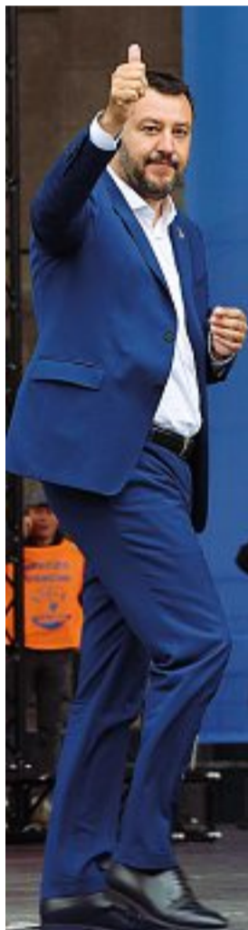
Matteo Salvini Ex ministro dell'Interno, segretario della Lega, Matteo Salvini, 46 anni, ha portato il Carroccio al 26,8% dei consensi in città