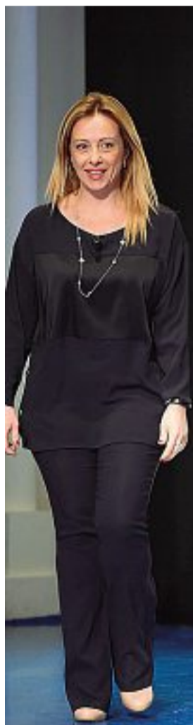
Giorgia Meloni Già ministro per la gioventù nel quarto governo Berlusconi, 43 anni, Giorgia Meloni ha portato Fratelli d'Italia a Milano al 12,9%

Dunque vantaggio del centrodestra. Almeno per le Politiche. Difficile proiettare il sondaggio sulle amministrative per il semplice motivo che l'elezione diretta del sindaco comporta diverse valutazioni rispetto al voto nazionale. C'è però un dato su cui ragionare. Riguarda un tema che è tornato di attualità in questi giorni. La possibile alleanza cittadina tra il Pd e i Cinque Stelle. D'altra parte, il sindaco Sala non ha mai fatto mistero che fosse necessario aprire una finestra di dialogo con i Cinque Stelle. Lo ha ribadito anche in questi giorni. E se si guardano i numeri in campo si capisce anche il perché: il 9,4 per cento attribuito ai Cinque Stelle sarebbe quello che permetterebbe alla coalizione di centrosinistra di sfiorare la barriera del 50 per cento e ai pentastellati di non sparire dall'agone politico (nel 2018 erano al 18,2). Per la precisione il 51,5. I numeri però non bastano a fare politica perché il 57 per cento degli intervistati ha risposto con un sonoro no alla possibile alleanza Pd-Cinque Stelle (11 per cento poco favorevoli, ben 46 per cento per niente favorevoli). Con un curioso rovesciamento di ruoli rispetto alle dinamiche nazionali. A essere i più convinti della convivenza sono gli elettori M5S (il 66 per cento). Più dubbiosi gli elettori del Pd (che si attestano al 51 per cento). In ogni caso, per la maggior parte dei milanesi, questo matrimonio non s'ha da fare.