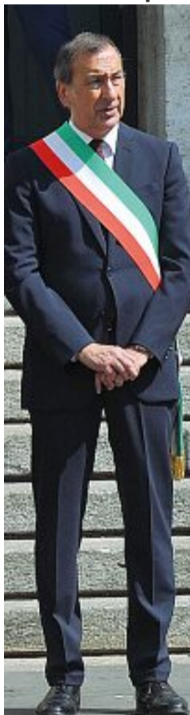
Giuseppe Sala Già amministratore delegato e commissario di Expo, 61 anni, sindaco dal giugno 2016: il suo consenso è salito al 69%