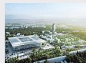
L'ipotesi Il progetto di Populous