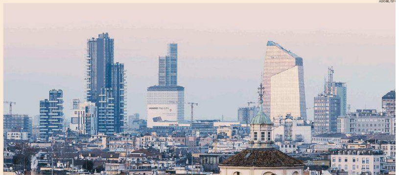
La crescita di Milano. Il Pil in progresso del 9,7% tra 2014 e 2018

Se il Pil qui cresce a velocità doppia è per effetto di scelte coraggiose e di un modello di collaborazione tra pubblico e privato che funziona. Un quadro che non deve suscitare invidia o gelosie, perché se Milano corre rappresenta un treno per l'intero Paese».