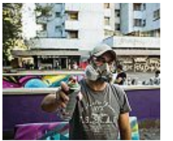
Spray Un artista dipinge una panchina