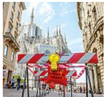
Sbarramenti Le transenne collocate in corso Vittorio Emanuele