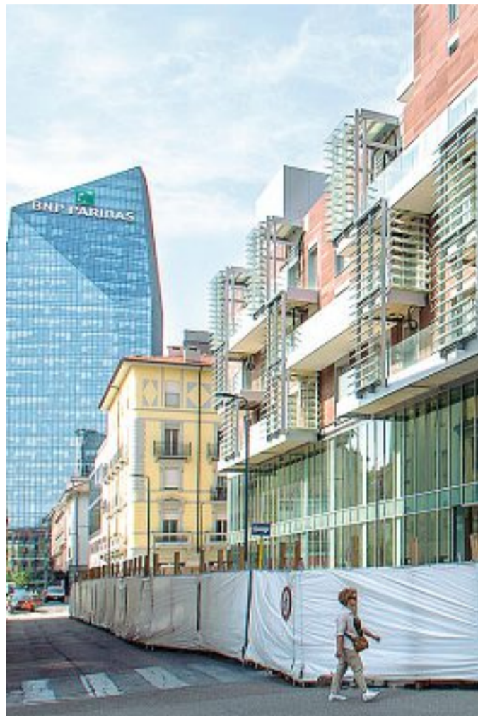
Via Pirelli L'edificio in costruzione in zona Porta Nuova