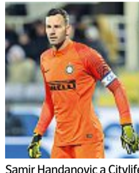
Samir Handanovic a Citylife