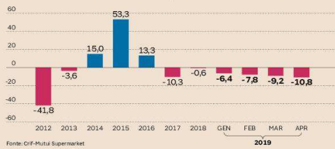
IL CALO DELLE RICHIESTE DI NUOVI MUTUI Numero di richieste: variazione % sull'anno precedente