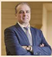
L'Intesa di ieri con le Regioni è storica, vogliamo migliorare in modo strutturale i servizi per il lavoro in Italia