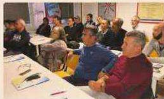
Corso Formazione SSL Portierato - Roma

L'Ebinprof, poi, volendo promuovere in modo fattivo la cultura della sicurezza nel comparto, ha strutturato e finanziato un programma formativo ad hoc, coinvolgendo le Parti Sociali (Confedilizia, Fiacams-CGIL, Fiascat-CISL, UILTU-CS) e le loro diramazioni territoriali. Nel 2018 sono stati così avviati, a Roma, i primi di una serie di corsi pianificati, nel corso del 2019, in tutta Italia. Il corso sulla sicurezza (gratuito per i lavoratori e per i loro datori di lavoro) prevede la frequenza del modulo dedicato alla formazione generale e a quella specifica nonché all'effettuazione del sopralluogo sul posto di lavoro del singolo lavoratore.