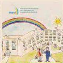
Copertina Manuale SSL Portierato

Anche nel comparto dei dipendenti da proprietari di fabbricati (dove peraltro il d.lgs. citato si applica in modo limitato ex art. 3, comma 9) il datore di lavoro deve provvedere affinché il lavoratore riceva un'adeguata informazione e una specifica formazione. La prima riguarda i rischi per la sicurezza e la salute connessi al lavoro in generale, le misure e le attività di protezione e prevenzione adottate, i rischi specifici cui il lavoratore è esposto in relazione a quanto effettivamente svolto, le normative di sicurezza e le disposizioni specifiche adottate in materia.