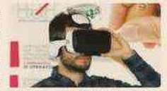
La formazione con strumenti all'avanguardia

diventandone parte attiva. Costruendo un percorso ad hoc dall'analisi dei bisogni, il lavoratore diventa primo testimonial e vero protagonista della formazione e della sua diffusione nell'azienda. La sensibilizzazione, pilastro a sé stante del percorso verso un'azienda a zero infortuni, è invece strumento che agisce lateralmente affinché il lavoratore possa consapevolmente assorbire le nozioni con spirito collaborativo e interattivo.