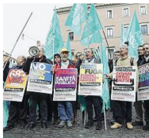
Camici bianchi Il sit in di ieri davanti al ministero

Marini chiede che il vuoto lasciato dall'esodo venga colmato dallo sblocco del turn over, con nuove assunzioni. Altrimenti si rischia di grosso. In due grossi ospedali della Calabria «due primari sono