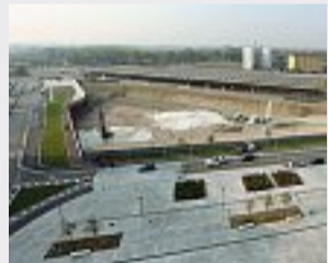
Oggi e domani Il cantiere di Spark e Beppe Sala davanti ai rendering

«I progetti definitivi subiscono continui rallentamenti, quelli esecutivi nessuno li ha mai finalizzati e validati, delle edificazioni nemmeno l'ombra — attacca ancora Zambelli —. A parte il codice degli appalti, c'è una precisa mancanza amministrativa che nel mio ruolo devo fare notare. Una giunta che dell'edilizia