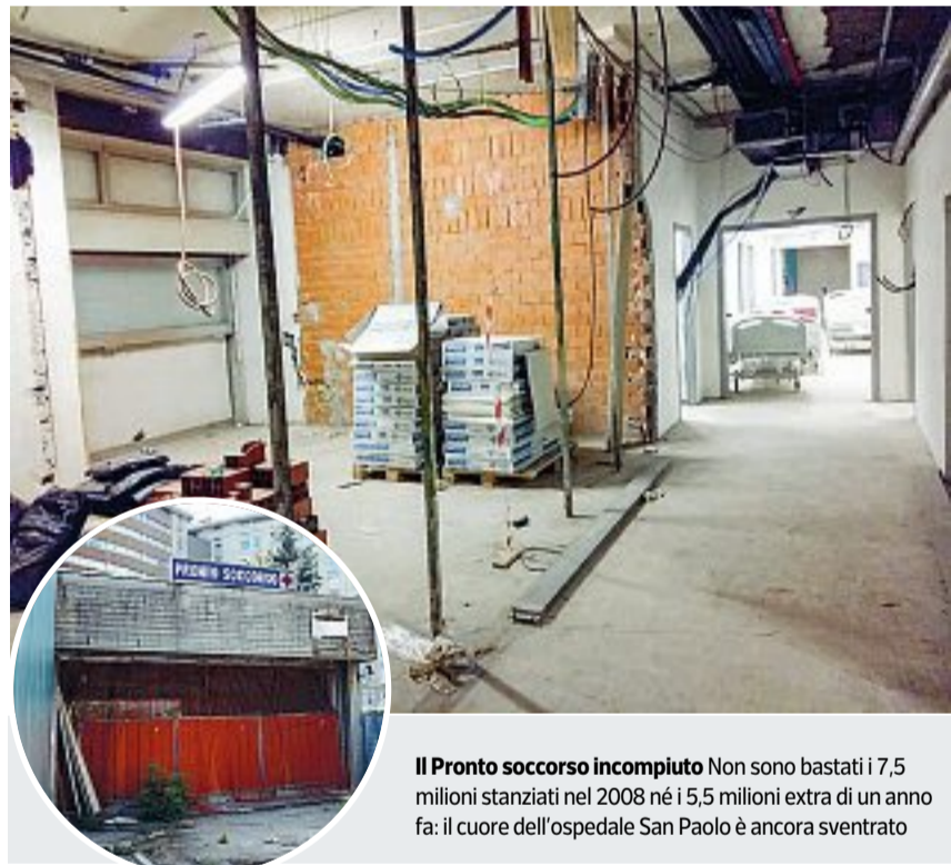
Il Pronto soccorso incompiuto Non sono bastati i 7,5 milioni stanziati nel 2008 né i 5,5 milioni extra di un anno fa: il cuore dell'ospedale San Paolo è ancora sventrato

Il Comune di Milano guidato da Beppe Sala non ha poteri in materia sanitaria, ma può fare da sprone alla Regione per non offuscare l'immagine della città; il Pirellone dove sulla poltrona più alta si è appena seduto il governatore Attilio Fontana non può trascurare progetti di primaria importanza: «La priorità di realizzazione delle opere