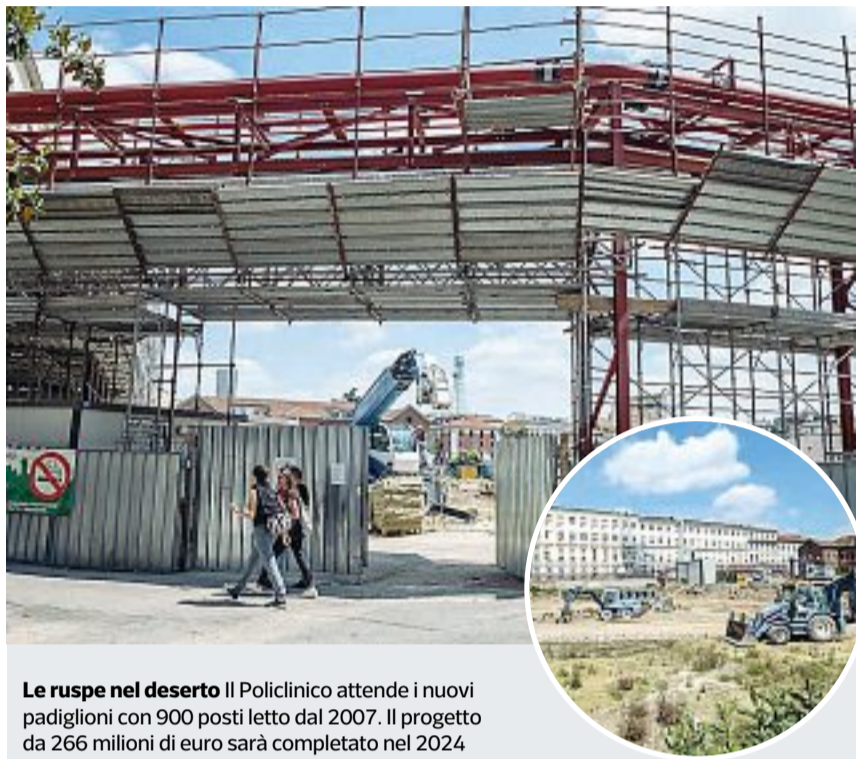
Le ruspe nel deserto Il Policlinico attende i nuovi padiglioni con 900 posti letto dal 2007. Il progetto da 266 milioni di euro sarà completato nel 2024

Gilardoni conosce bene tutti i meccanismi che possono portare ai ritardi nella chiusura dei cantieri: rallen-