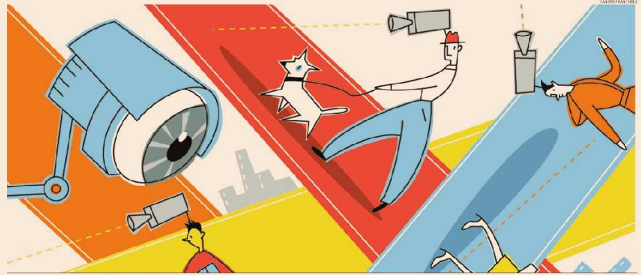
Il battesimo e i compiti del «Data protection officer»

Esigenza che è funzionale anche al ruolo del Dpo, il quale deve fungere da tramite tra l'azienda o l'amministrazione in cui lavora e il Garante. Dispone di una mappa nazionale aggiornata di tutti i Dpo consentendo, infatti, all'Autorità di poterli contattare per inviare documentazione e aggiornamenti o segnalare iniziative. La prima delle quali si svolgerà il 24 maggio a Bologna, dove il Garante incontrerà tutti i Dpo alla vigilia del day della privacy.