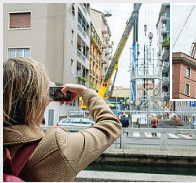
L'operazione Al posto dell'antenna Telecom di via Bettinelli, in zona Darsena, nascerà una residenza per giovani con caffetteria e coworking