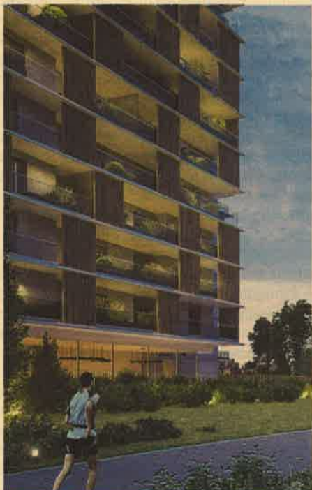
Il render dell'intervento UpTown a Milano

Il 28 settembre, infatti, è avvenuta la posa della prima pietra del primo lotto di UpTown, nuovo smart district di Milano. Lotto che comprende due edifici per un totale di 137 appartamenti, curati da Scandurra Studio e Zanetti Design Architettura, che si prevede di consegnare a marzo-giugno 2019.