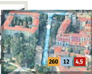
3 Conca di Viarenna