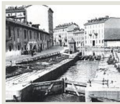
immagine storica della conca