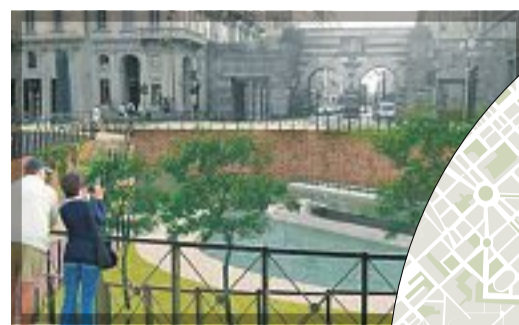
2 Piazza Cavour rendering